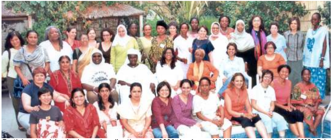
Participantes à la réunion « plan d'action » de 2006 du réseau WLUML au mois de juillet 2006 à Dakar, au Sénégal. Deux autres participantes, du bureau international de coordination et du Mali, étaient absentes au moment de la prise du photo.

En juillet 2006, le réseau Femmes Sous Lois Musulmanes (WLUML) a organisé pendant une semaine une réunion « plan d'action » à Dakar, au Sénégal. Suite à notre réunion plan d'action (1997) précédente, celle du Sénégal visait à réviser les priorités thématiques, les stratégies et la structure organisationnelle du réseau, pour s'assurer qu'elles soit bien adaptées aux besoins, aux préoccupations et aux capacités des participantes de notre réseau. Le Plan d'Action (PA) qui en résulte guidera le réseau WLUML pendant les cinq années à venir.