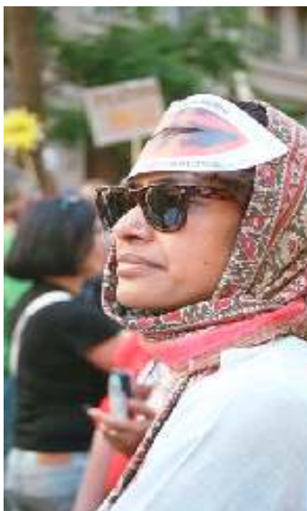
Dialogues féministes, janvier 2005, Brésil

http://www.wluml.org/english/newsfulltxt.shtml?cmd[157]=x-157-119969